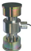
Kit de plaques - Plates kit