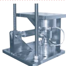
Stabican 200 t